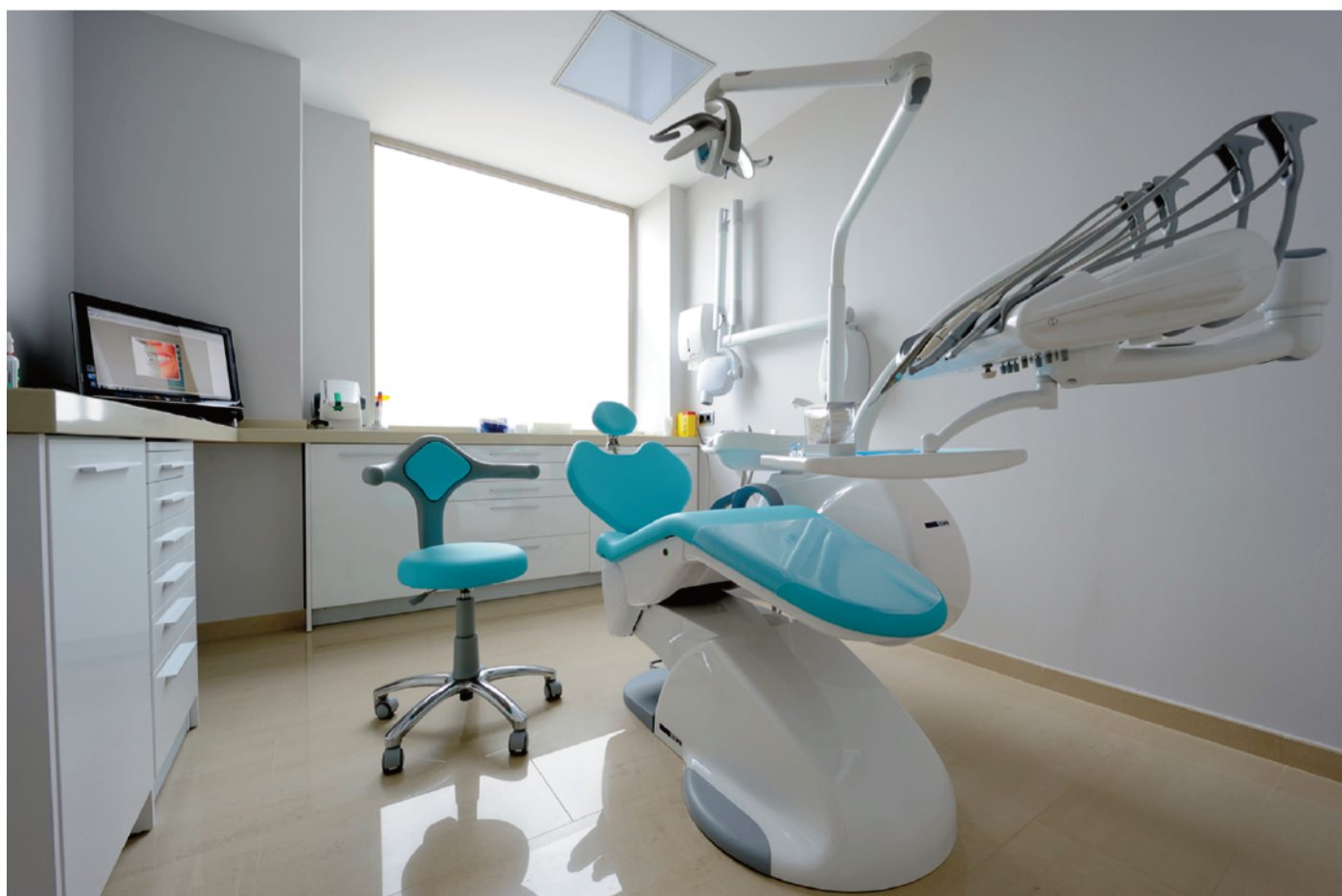
La Clínica Smilodon dispone de equipamiento médico de última generación

Aunque en España no hay cultura de acudir a una clínica dental para que tratar la apnea del sueño, lo cierto es que podemos diagnosticarla y tratarla, siempre en casos leves o moderados. Clínica Smilodon es uno de los centros de referencia a nivel nacional en este ámbito.